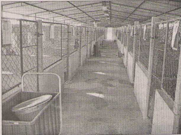
Abrigo tem 30 baias com 25 metros quadrados cada uma

Outra forma de ajuda é a adoção à distância no qual o colaborador adota um cão contribuindo com R$ 30 por mês. "São poucos os que têm consciência que com uma pequena quantia por mês podem contribuir para dar um local apropriado para um cão, onde ele é bem alimentado e recebe carinho e cuidados", acrescenta Rosana.